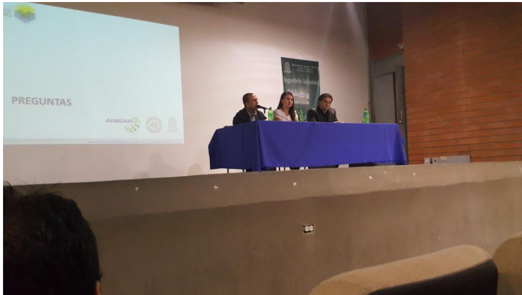
Ilustración 2. Panel de conferencistas.