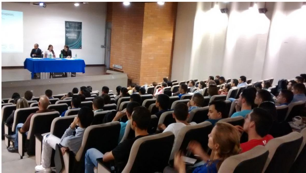
Ilustración 3. Público asistente.